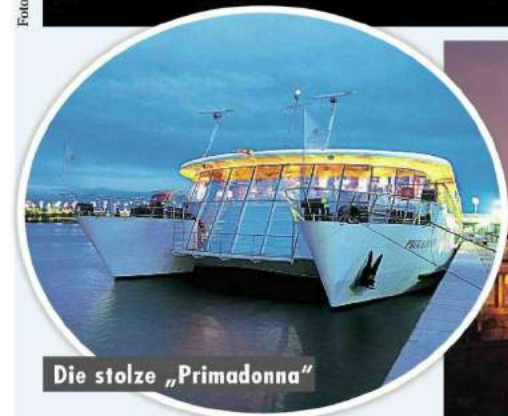
Die stolze „Primadonna“