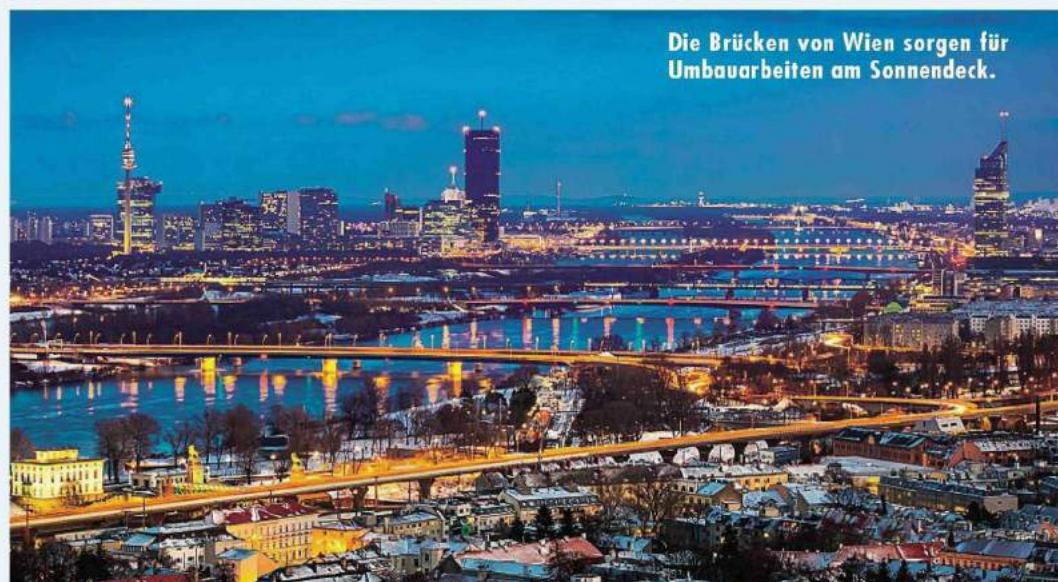
Die Brücken von Wien sorgen für Umbauarbeiten am Sonnendeck.

P reisfrage: Wer hat die alte Ballade vom Prinz Eugenius, dem edlen Ritter, noch in der Schule gelernt? Belgrad hat er erobert, aber auch Peterwardein, die größte Festung Europas, hat dabei eine Rolle gespielt, als das kaiserliche „Schlachtenungewitter“, mit seinen Truppen um 1717 die Türken in die Flucht schlug.