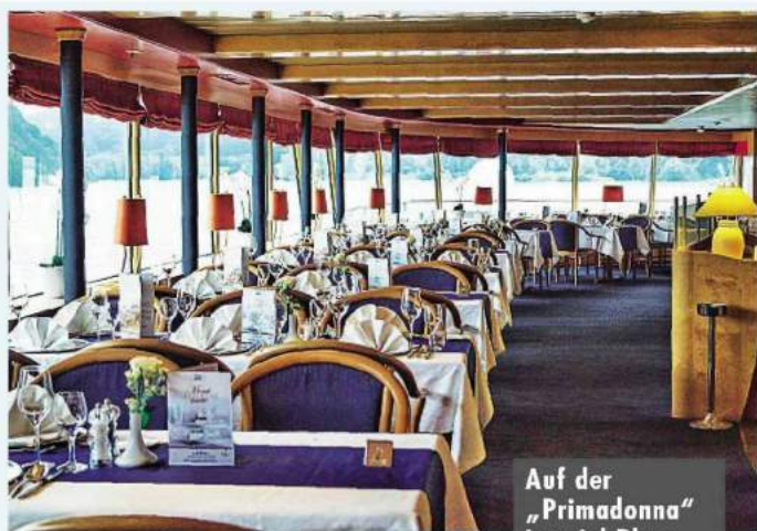
Auf der „Primadonna“ ist viel Platz, auch für einen Wellnessbereich.