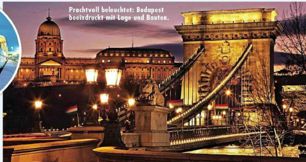
Prachtvoll beleuchtet: Budapest beeindruckt mit Lage und Bauten.